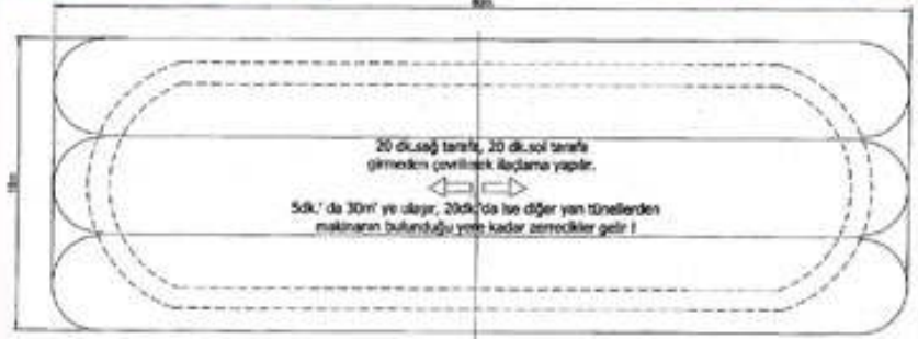
1080m2' lik Sera Alanı